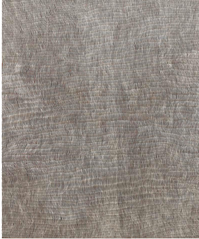
Yukultji Napangati, Untitled (2001)

Possiamo vedere solo un certo numero di pezzi di iperoggetti per volta. Si manifestano non-localmente, ci appaiono come scorci temporali proprio perché sono transdimensionali; così come di uno tsunami o di un caso di malattia da radiazione, vediamo solo alcuni frammenti di iperoggetto. Se una mela invadesse un ipotetico universo bidimensionale, gli abitanti di quell'universo vedrebbero per prima cosa dei punti e poi una rapida successione di forme come una macchina circolare che si espande e si contrae diventando un minuscolo cerchio, poi un punto, fino a scomparire. La fluidità di una lava lamp (il New Materialism abbonda di metafore che fanno riferimento ai fluidi) è il simbolo di quanto la nostra percezione sia inadatta a cogliere la multidimensionalità della struttura – il luogo in cui dimorano gli iperoggetti.